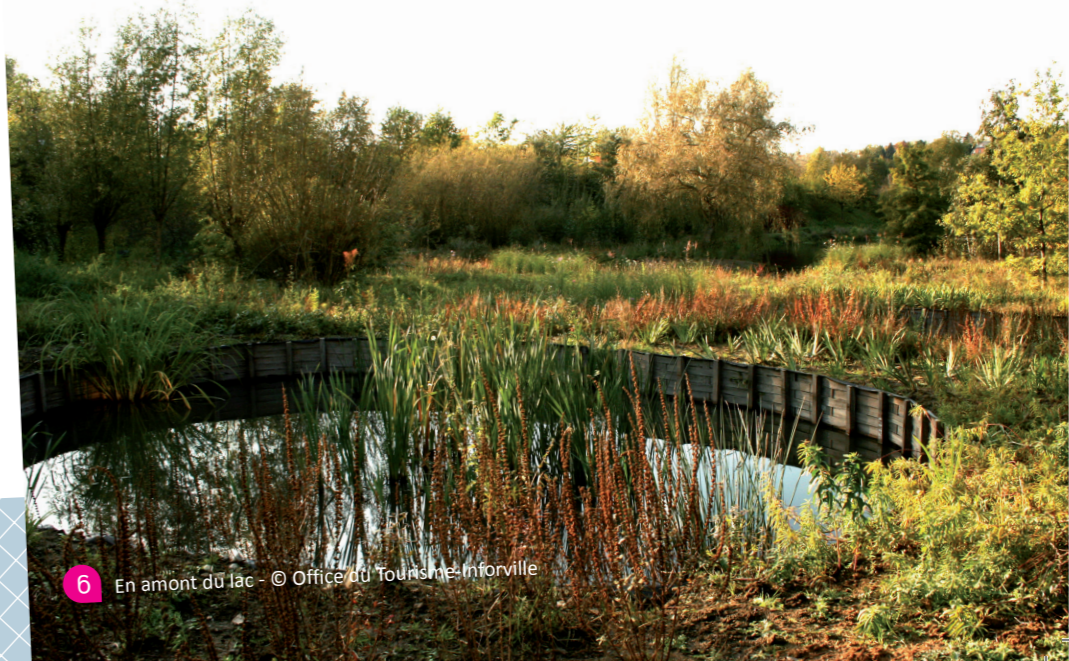
6 En amont du lac