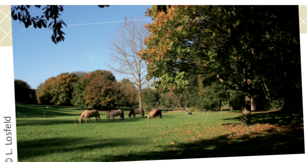
À l'opposé de la rue la Serpentine, s'est installé le « Terrain d'aventure », paradis échevelé de cabanes, tipis et animaux de la ferme (chèvres, poules, lapins, ânes et poneys).