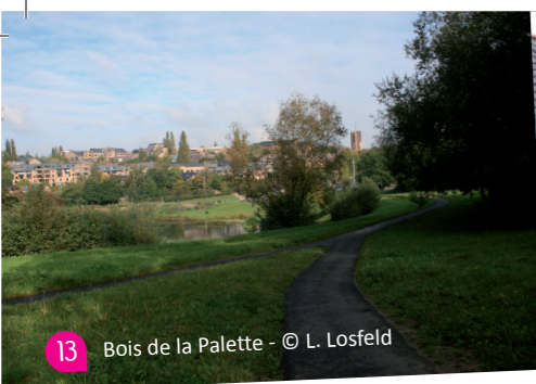
13 Bois de la Palette