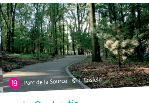
19 Parc de la Source