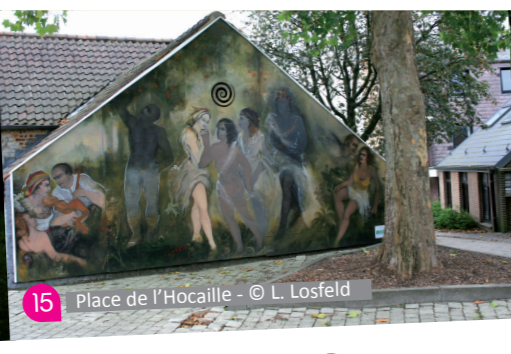
15 Place de l'Hocaille - © L. Losfeld