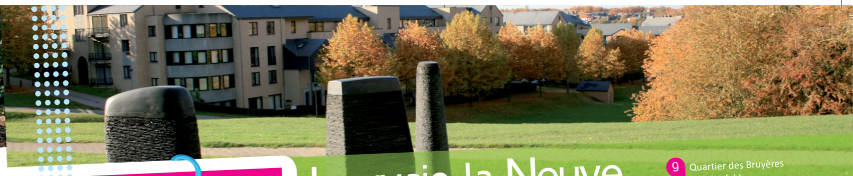
9 Quartier des Bruyères