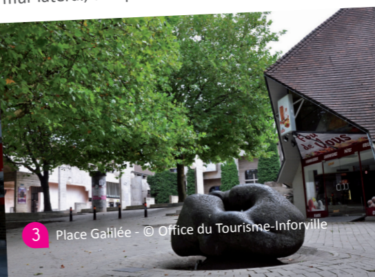
3 Place Galilée