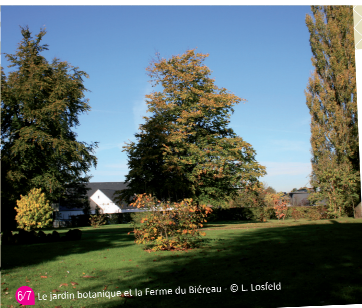
6/7 Le jardin botanique et la Ferme du Biereau