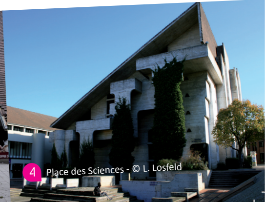
4 Place des Sciences