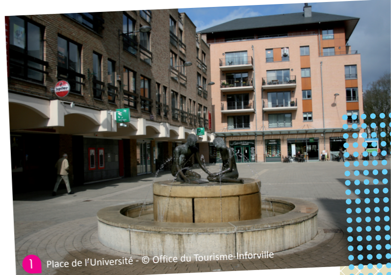
1 Place de l'Université

Au pied de la montée, sur un pan du bâtiment des Halles, on peut admirer la gigantesque fresque inaugurée en 1987, due à l'artiste Roger Somville : « Qu'est ce qu'un intellectuel ? ». Sur le mur latéral, une phrase