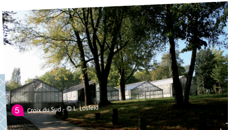
5 Croix du Sud

En continuant par la rue Jean d'Outremeuse, on accède à un grand parc qui sert de pâturage aux chevaux de la Ferme équestre. Un projet de logements sociaux y verra peut-être le jour dans le futur. Aussi appelée Ferme des Bruyères, la Ferme équestre organise des cours et des stages dans son centre d'hippothérapie.