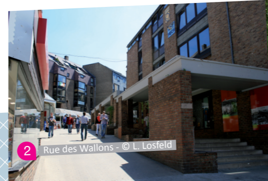
2 Rue des Wallons

Plus vieille place de la cité et l'un des ensemble les plus remarquables entièrement construit en béton, cette place est un lieu de rencontre et le trait d'union entre les zones académiques et résidentielles du quartier du Biéreau. Son sol est recouvert de billes de chemin de fer et elle est bordée par la belle Bibliothèque des Sciences et Technologies conçue par l'architecte Jacqmain.