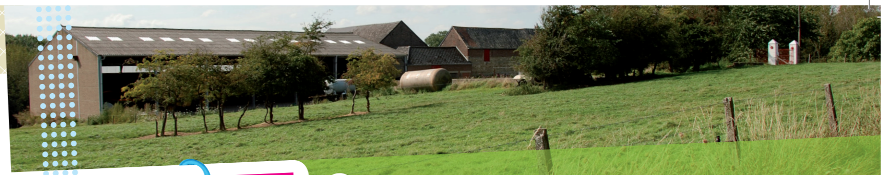
9 Ferme des Hayettes

Les quelques maisons bordant cette rue pavée, dont le nom rappelle les occupants de Moriensart au XX ème siècle, sont généralement délimitées par des haies mellifères. Ces haies composées de troènes, cornouillers, aubépines, viornes... offrent par leur floraison étalée de mars à septembre, une source d'alimentation mais également un site de nidification aux insectes pollinisateurs.