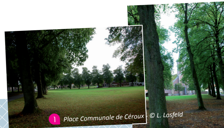
1 Place Communale de Céroux

La pièce d'eau qui se trouve à cet endroit recevait autrefois les eaux usées de Céroux. Dans les années 2000, d'importants travaux d'égouttage ont été réalisés et les eaux orientées vers la station d'épuration de Palland. Aujourd'hui, la mare joue un rôle d'auto-épuration.