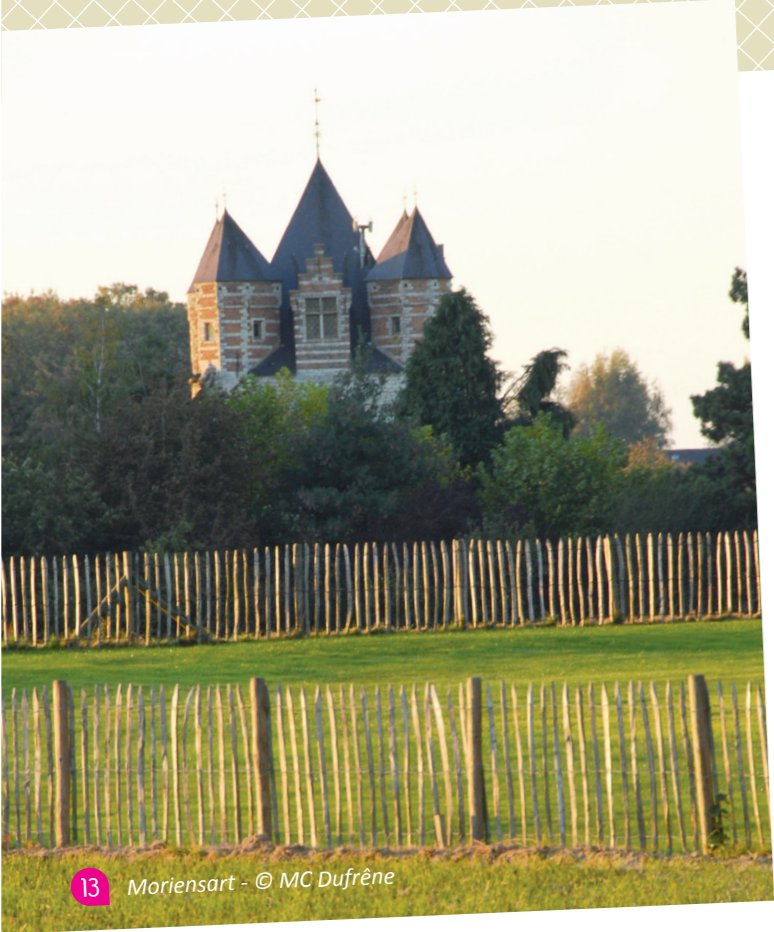
13 Moriensart