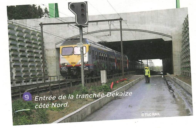
9 Entrée de la tranchée Dekaize côté Nord.

voûte. Dans le cadre des travaux de mise à quatre voies (RER), le pont a été remplacé par une tranchée couverte en béton armé. Les buts sont multiples : outre le besoin de stabiliser les talus et d'élargir la voirie, la volonté était également de retrouver le paysage d'origine sans saillie due à la ligne ferroviaire. Enfin, côté Nord, une zone de la tranchée couverte permet le passage de la faune.