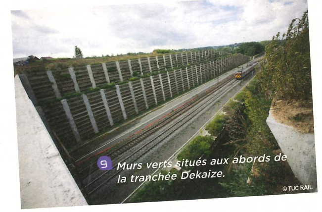
9 Murs verts situés aux abords de la tranchée Dekaize.

Au milieu de l'ouvrage, jetez un coup d'œil vers Ottignies. Vous verrez un large panorama. D'un côté, l'axe traversant de la ligne ferroviaire vers Namur, avec au premier plan, de part et d'autre, le système de soutènement en élément de béton armé contenant de la terre (murs verts). La terre peut accueillir de la végétation - raisons esthétiques et écologiques, notamment - mais celle-ci est volontairement pauvre, pour en limiter l'entretien. Au deuxième plan, vous voyez le pont du Buston du haut et sur la gauche, divers bâtiments liés à l'exploitation ferroviaire. Le premier est composé d'un train-wash, d'un poste d'entretien des trains et d'un bâtiment destiné au personnel de la SNCB. Le deuxième, à l'arrière du premier, est une sous-station de traction qui permet d'alimenter la caténaire.